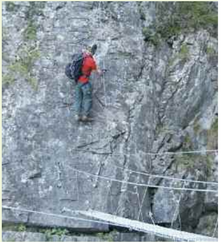
La passerella sul lago