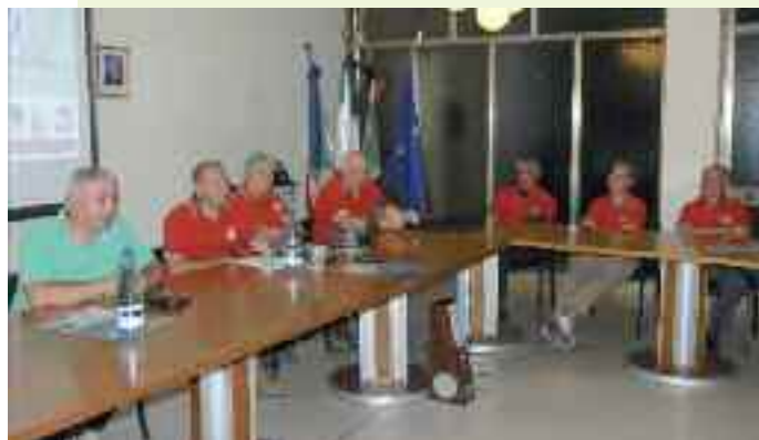
La presentazione nella sala Consiliare di Idro